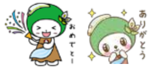
▲ スタンプの絵柄(一例)