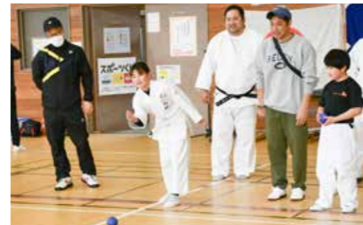
▲ スポーツ交流会の様子

村スポーツ協会の総合開会式が村民体育館で行われ、1年間の活躍を祈念して13単会の選手の皆さんが参加しました。開会式後、各単会のスポーツ交流会として「ポッチャ」が行われ、健康づくりや交流の促進を図りました。