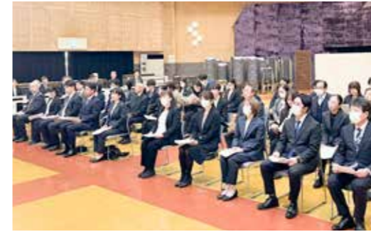
▲ 合同離任式の様子

村内教職員の合同離任式が村文化センターで行われました。式では異動・退職となった先生方が紹介され、村内の子どもたちへの指導や支援に感謝の意を表し、村から感謝状が贈呈されました。