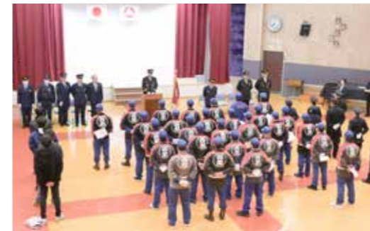
▲ 辞令交付式の様子

村文化センターで消防団辞令交付式が行われました。新入団員等に対し団長から辞令書が渡され、統監である村長より、消防団に課された役割を学び、予防消防に従事するよう訓示がありました。