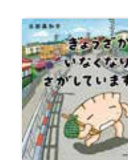
講談社 きょうざがいなくなりさがしています 玉田 美知子：著

きょうざがいなくなった不思議な世界を探る、想像力をかきたてる物語。たくさんのきょうざ愛に包まれて、第17回 MOE 絵本屋さん大賞 2024 新人賞第1位等多数受賞。