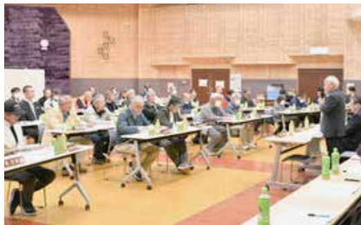
▲ 行政区長会の様子

令和8年度の行政区長会が村文化センターで開催され、全52行政区の区長へ委嘱状が交付されました。行政区長の業務内容や重点事業等の説明があり、区長会終了後、兼務する保健委員会総会も開催されました。