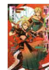
Gakken 戦国×兄弟 豊臣兄弟-炎の絆 田中 創・越智屋 ノマ：著

兄弟の力を合わせ、天下統一という夢を成し遂げた豊臣兄弟。歴史好き、戦国武将好きはもちろん、大河ドラマの予習をしたい方にもおすすめ。織田兄弟と島津兄弟の物語も併録。