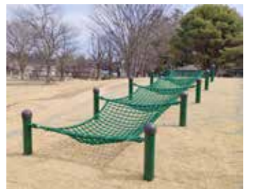
問 建設課 事業 G ☎ 25-1117