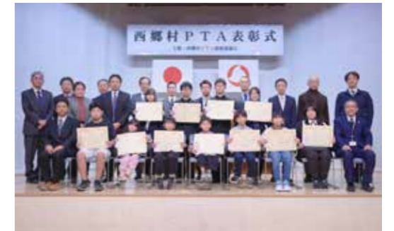
▲ 受賞された皆さん（賞状を持っている方）

村文化センターで村PTA表彰式が行われ、「家族で考えよう 電子メディアとのつきあい方」標語を募集し、優秀作品に選ばれた12名の園児・児童・生徒が表彰されました。また、PTAとして功績を残された1名が表彰されました。