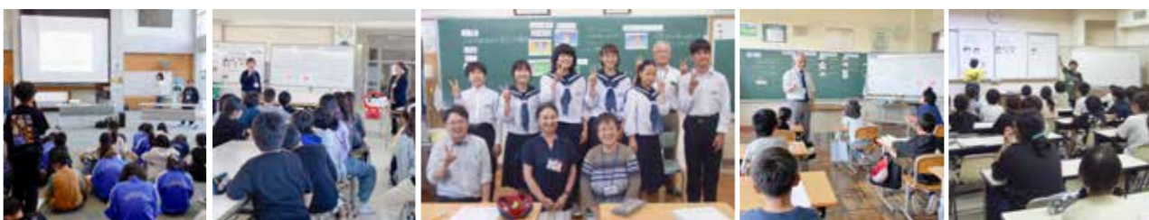
▲各所での人権教室の様子

村人権擁護委員によるこの教室は、人権を尊重することの大切さを広めるために行われています。子どもたちが理解を深めることができるようビデオ等を活用し、いじめ等をテーマに、相手の思いやる心や生命の尊さについて伝えました。