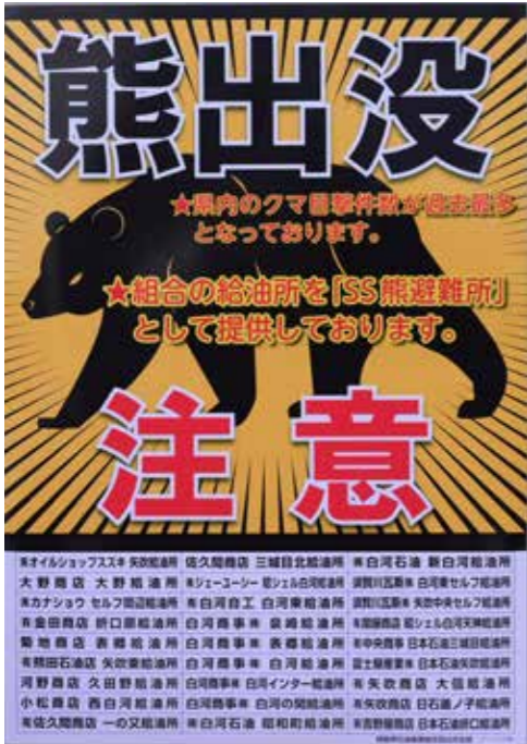
▲ 目印となるポスター

白河市・西白河郡内でクマに遭遇してしまったときは、下記ポスターのあるガソリンスタンド（福島県石油商業組合西白河支部加盟店舗）へ避難してください。