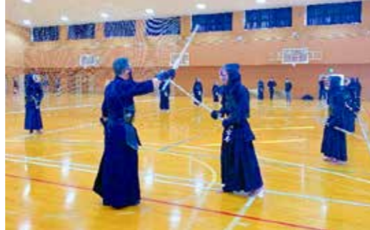
▲ 地域クラブ活動の様子（左：卓球 / 右：剣道）