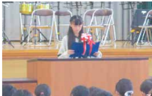
▲ 熊倉小学校の式典の様子