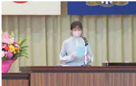
▲ 羽太小学校の式典の様子

村立小学校のうち、小田倉・熊倉・米・羽太の4校は、今年度創立150周年を迎えます。11月7日(金)には羽太小学校で、11月27日(木)には熊倉小学校で、それぞれ記念式典が開催されました。