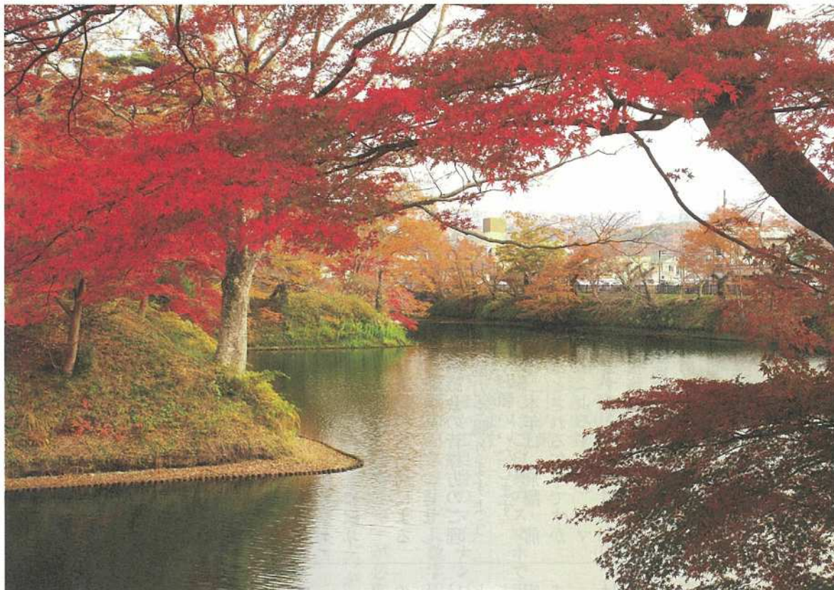
棚倉城址公園（棚倉城は築城400年を迎えました）