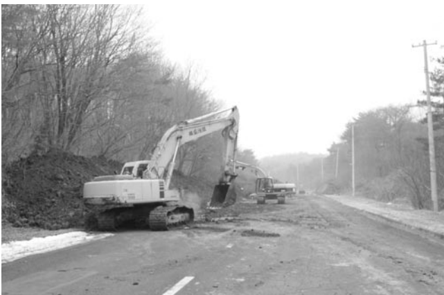
▲土砂崩れ現場の復旧作業