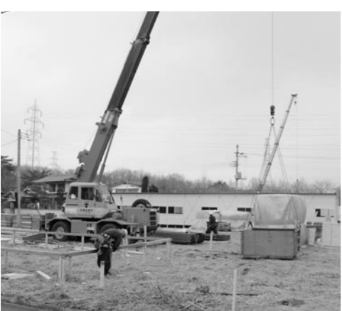
▲仮設住宅着工（狼山合）