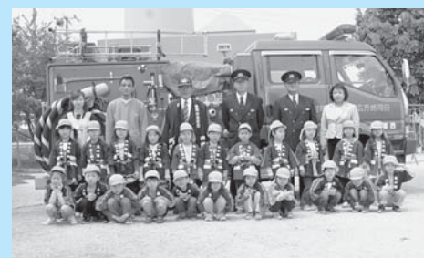
▲チョットすまして！（みずほ保育園園児）