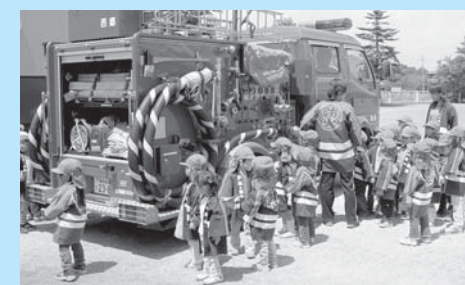
▲消防自動車に興味津々