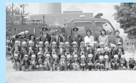
▲はいチーズ！（まきば保育園園児）