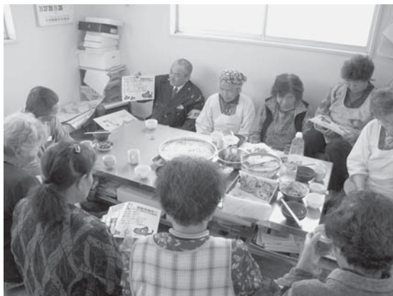
▲川谷地区での防犯講話の様子（4/28）