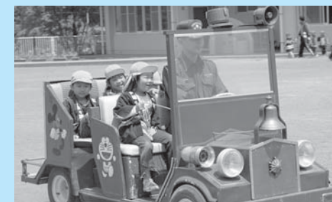
▲ミニ消防自動車に乗って大喜び