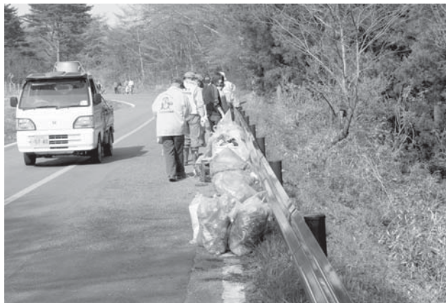
▲地元行政区の方々と拾い集めたごみ