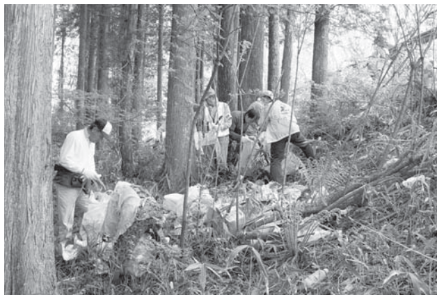
▲目立たない場所に大量にごみが捨てられていました

一人ひとりの意識が大きな力となり、村全体を変えます。みんなで「きれいな西郷村」を目指しましょう。