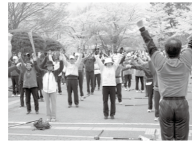
▲まずは、しっかりと準備体操

西の郷スポーツクラブ主催による、第1回西郷さくら祭りパークゴルフ大会が、4月18日に太陽の国で行なわれました。 パークゴルフは、村内の西の郷パークゴルフ協会が50名を数えるほどの人気スポーツです。 当日は、桜も満開で、近隣市町村のパークゴルフ協会からも参加があり、全員で91名を数えました。 太陽の国パークゴルフ場は、パー66。参加者は、日頃の練習の成果を存分に発揮していました。 この日、同じ太陽の国で、西郷さくら祭りや第5回観桜健康ウォーキング大会も行なわれ、合同の開会式となりました。