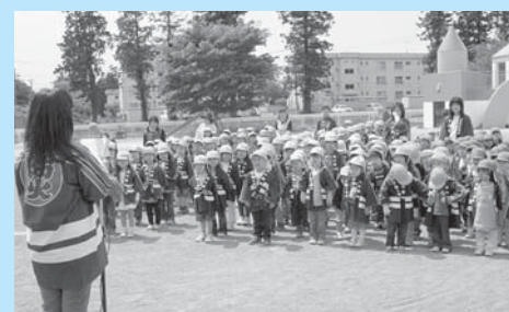
▲「誓いの言葉」を大きな声で