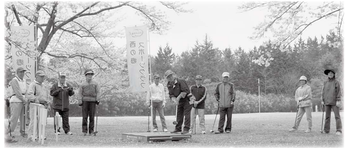
▲満開の桜の下、太陽の国で行なわれたパークゴルフ大会