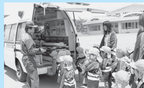
▲救急車には何人乗れるのかな？