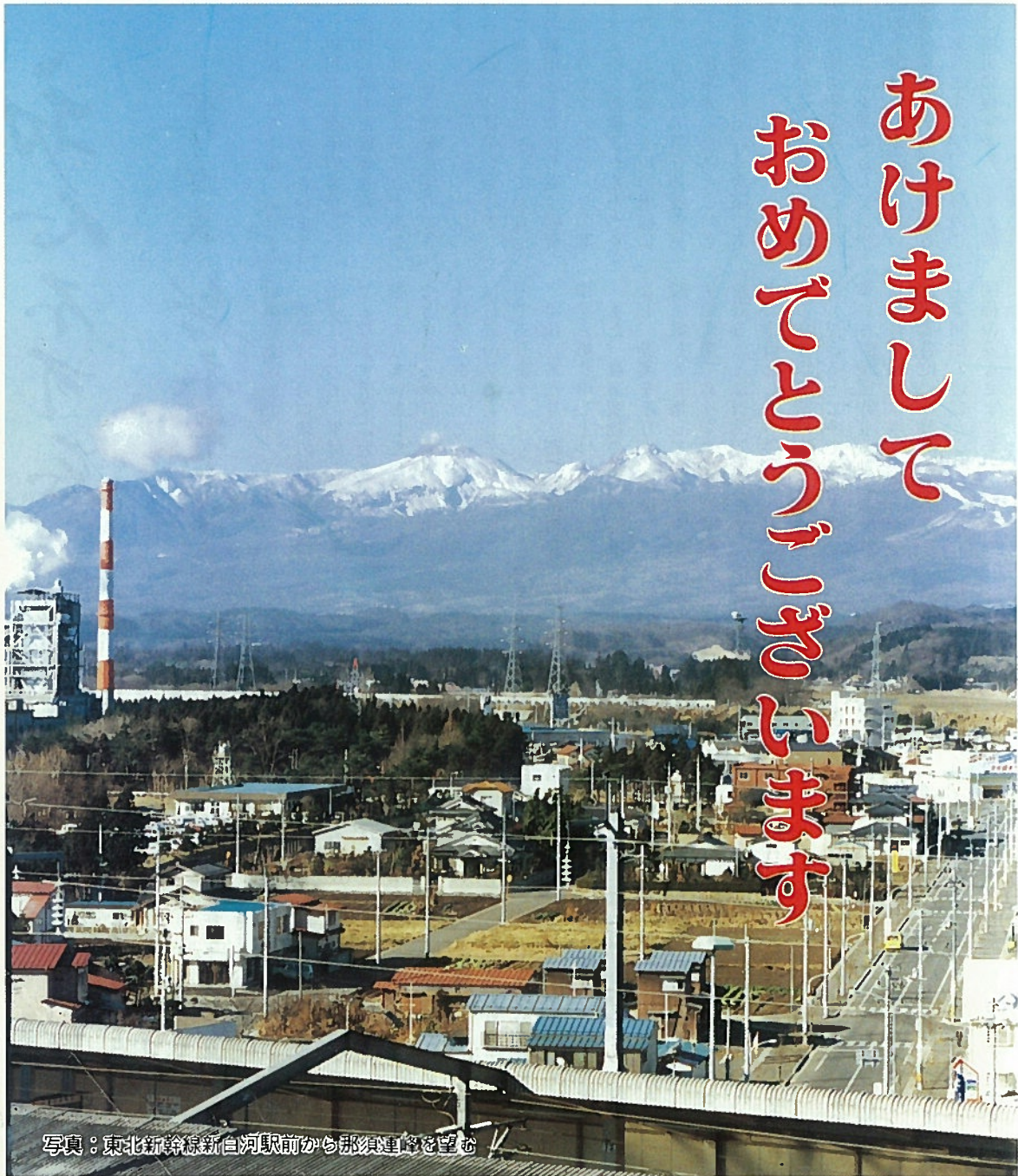
写真：東北新幹線新白河駅前から那須連峰を望む

■人口のうごき 人口15,588人(+19) 男7,873人(+6) 女7,715人(+13) 世帯数3,807戸(+2) 12月1日現在( )は対前月比