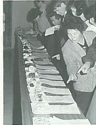
▲これが一番おいしそう！

ってパンやラーメンなどを主食とする機会が多くなり、米飯を食べることが少なくなっています。米の消費拡大を図るにも米食を中心とした日本型食生活を見直そうと、昨年の十二月二十二日、白河地方おにぎりコンクール（白河農政事務所、西白河・東白川農業改良普及所、白河地方産米改良協会主催）が実施されました。