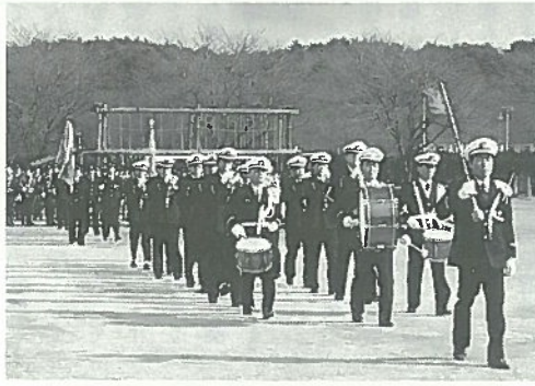
▲ラッパ隊を先頭に分裂行進

を一層發揮していただき、村民の生命と財産を守っていただく一方、災害、犯罪等のない住み良い村を建設して行きたい。」と訓示が述べられました。