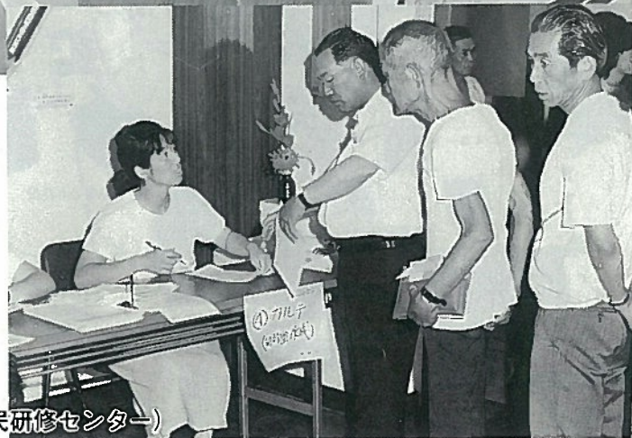
写真：総合検診から (上野原農民研修センター)