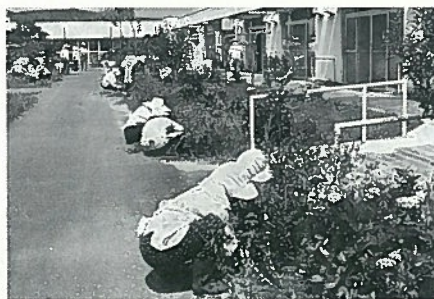
▲草取りに精を出す会員ら(さつき荘)

「太陽の国 ボランティア活動」社会福祉施設・太陽の国を知ろう。今年度の「太陽の国」