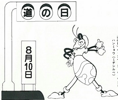
「道の日」キャンペーンキャラクター ハンミョウ(ミチシルベ)

道路は日用品の九九・五%、生鮮食料品の九八・二%を運ぶなど、私たちの生活を豊かにするために、欠くことのできない基本的施設ですが、欧米諸国と比べると以下の整備水準であり、まだまだ遅れています。 二十一世紀に向けて、急速な高齡化など国民生活をとりまく環境の変化に対応して、真に豊