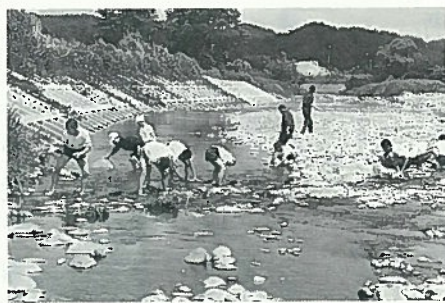
▲調査を行う西一中の生徒達 (阿武隈川)

川底に住んでいる生物の種類を調べることによって、水質の状況がわかります。たとえば、「サワガニ」がいればきれいな水、「ヒル」がいればきたない水ということになります。このサワガニやヒルのように水質の状況を知ることのできる生物を指標生物といい、現在一六種類の生物で一般的に調査が行われています。また、水質は①きれいな水、②少しよごれた水、③きたない水、④大変きたない水の四段階に分けられています。七月八日(水) 西郷第一中学