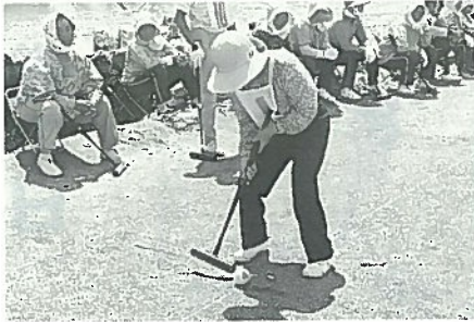
▲第1ゲートめがけて……