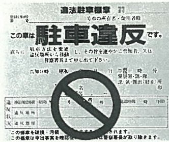
▲違法駐車車両に取り付けるステッカー