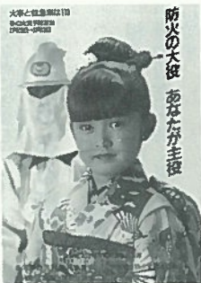
防火の大役 あなたが主役

各家庭、事業所等では、火を使う前と使った後に、必ず火の元、火気使用器具の周囲を点検し火災予防に御協力願います。