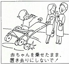
赤ちゃんを乗せたり、置き去りにしないで。