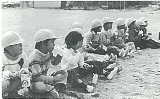
▲ おいもがおいしそう

午前九時から村長あいさつのもと、子供の成長をいろいろな角度から見せようと、日頃練習した成果をこの日のために園児たちは舞台で劇やおゆづきを披露し、父母やおじいちゃん、おばあちゃんの大喝采を浴びました。