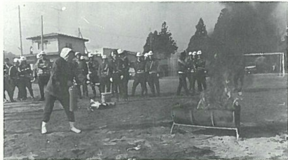
▲地区民による油火災消火訓練

訓練終了後、羽太小校庭で西郷分署員からの消火器の取扱い方法の説明を受けたあと、燃焼皿を使用した油火災消火訓練とプロパンガス消火訓練が行われました。