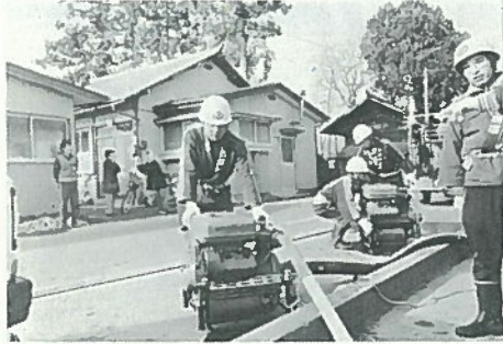
▲部署及び送水準備