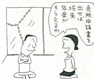
保険料の免除申請はお早目に

△心身障害者が受けられる特典 ▽ 所得税では、納税者本人や扶養家族の中に障害者がいる場合、障害者控除として一人当たり二十五万円（特別障害者の場合は三十三万円）を所得金額から差し引くことができます。 また、物品税では、目や足の不自由な方などが利用するもので、本人又は家族が運転する小