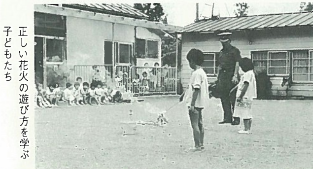
正しい花火の遊び方を学ぶ子どもたち