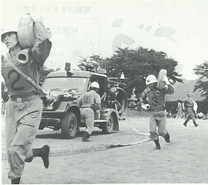
正確にそして速く

この結果、ポンプ車の部では原中消防団が、小型ポンプの部では上羽太消防団がそれぞれ優勝しました。成績は次のとおりです。