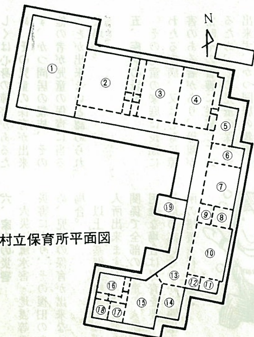
村立保育所平面図