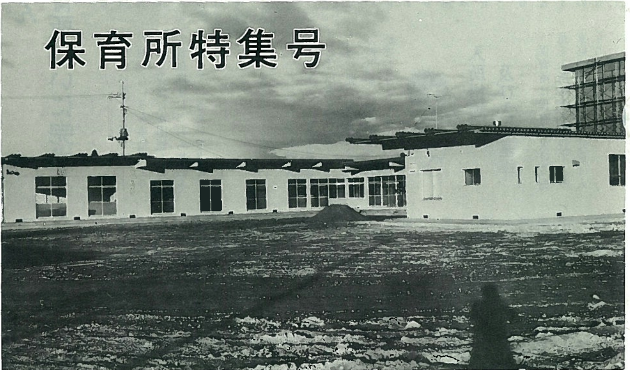
西郷村大字米字向山地内に完成した村立保育所