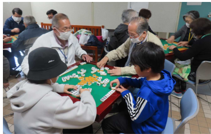
<健康麻雀：西郷健雀サロン>