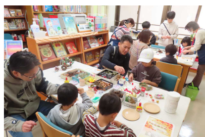
<ワークショップ：図書室>