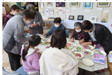
<押し花：押し花教室カトレア会>

この体験コーナーには、 255名 の来場がありました。参加者からは、「とても楽しく体験ができた」「機会があればまた体験したい」などの感想がありました。