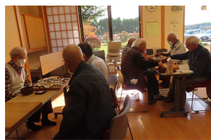
<囲碁：西郷囲碁クラブ>