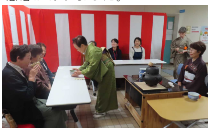
<お茶会：西郷村茶道会>