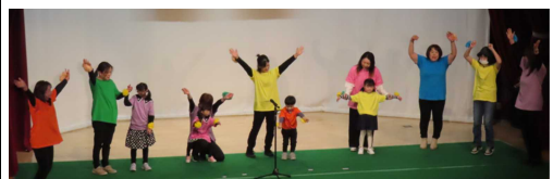
<NPO法人ほっとアクト>