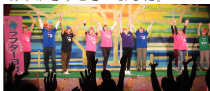
<西郷笑いヨガクラブ>