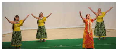
<ララ・ティアレ・フラサークル>