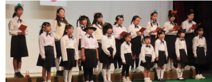
<西の郷少年少女合唱クラブ>