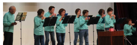
<オカリナサークル>