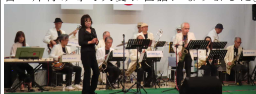
<にしごうジャズ研究会>

なお、今回の文化祭(芸能発表会)では、実行委員・文化協会各単会の皆様には、事前の準備・当日の運営・片付け等で大変お世話になりました。ありがとうございました。