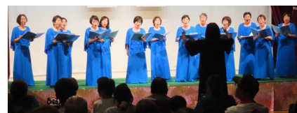
<コーラスにしごう>