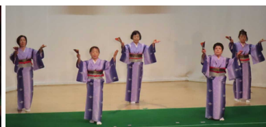
<西郷村ふるさと踊り保存会>