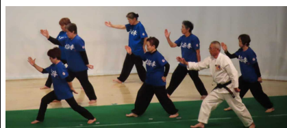
<西郷太極拳クラブ>