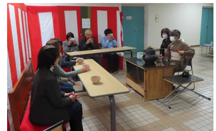
<お茶会：西郷村茶道会>