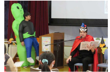
<こども司書とALTの読み聞かせ>