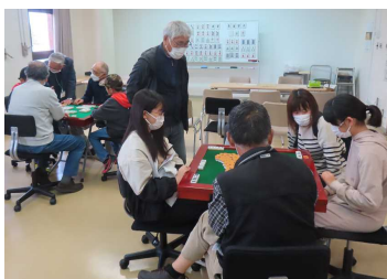
<健康麻雀：西郷健雀サロン>