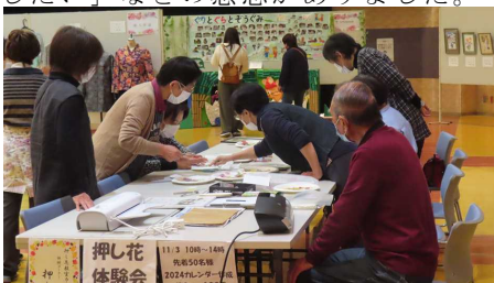
<押し花：押し花教室カトレア会>

作品展示会とともに、文化協会加盟団体による体験コーナーも行われました。この体験コーナーには、3日間で 170名 の来場者がありました。参加者からは、「とても楽しく体験ができた」「機会があればまた体験したい」などの感想がありました。