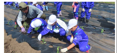
< さつまいも苗植え：小田倉小 >