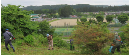
< 希望ヶ丘の草刈り：西二中 >

中学校区のコーディネーターが学校からの要望に応え、地域ボランティアと連絡調整を行い、学校の環境整備や体験活動等の支援をします。今年度も、地域の皆様には各学校の支援でご協力いただいています。