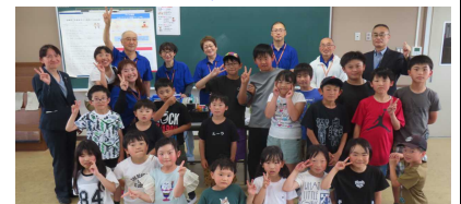
<小田倉子ども教室>