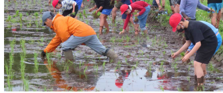
< 田植え：熊倉小 >