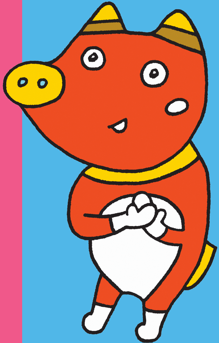
ふくしま応援! 「ペコ太郎」