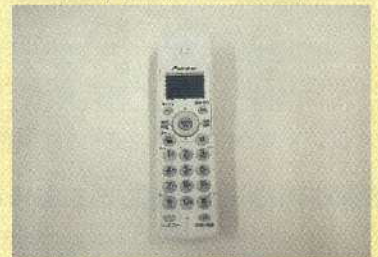
コードレステレホン