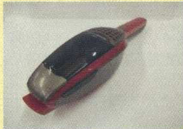
ハンディクリーナー