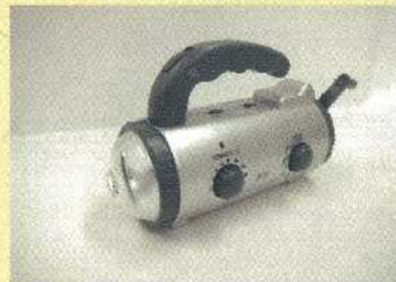
発電（充電）式ラジオ