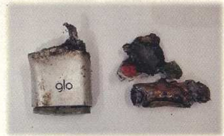
火災の原因と思われる小型充電式電池

小型充電式電池はあらゆるところで使われており、その種類も乾電池に似たものから電池パックのものなど、形もいろいろあることから、すべてを施設で選別することは困難でありますので、火災事故防止及び資源（希少金属）の再利用を図るため、住民の皆様のご協力をお願いします。