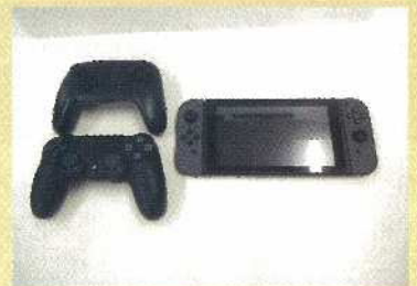
ゲーム機・コントローラー