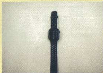
スマートウォッチ