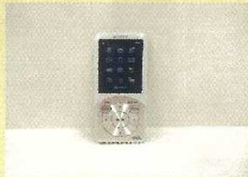
ポータブルオーディオプレーヤー