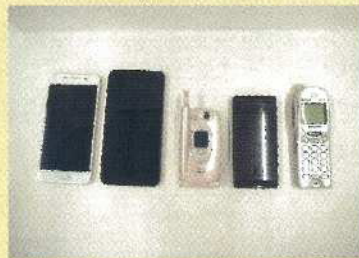
スマートフォン・携帯電話