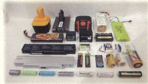
さまざまな小型充電式電池