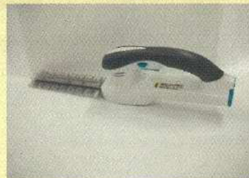
電動ヘッジトリマー