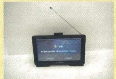
ポータブルナビゲーション