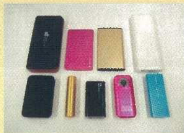
モバイルバッテリー