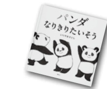
講談社 パンダなりきりたいそう いりやまさとし：作

卵焼きが大好きな王さま。題名から「あれ？ぞうって卵産むの…？」と思うよね。絵本だけど字数が多くて読みやすい小学生向けの王さまシリーズ！