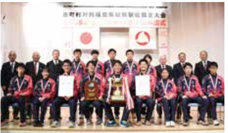
▲優勝報告を行った選手と関係者