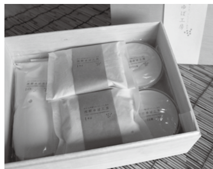
▲桐箱入り西郷ゆば工房ギフトセット

☎ 問 西郷ゆば工房 09016251 14638 住所…羽太字馬廻35-2 販売先…自社ホームページ まるごと西郷館