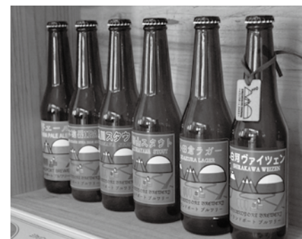
▲製造している6種類のクラフトビール

住所…小田倉字大平131-3 販売先…カフェお家パンオブ まるごと西郷館 イオン白河西郷店