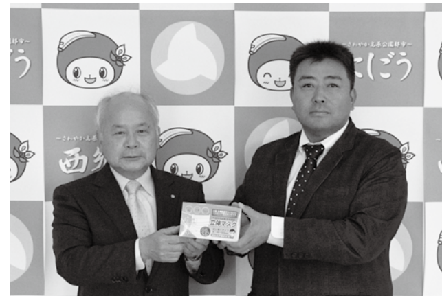
▲村長へマスクを寄贈する青木社長（右）