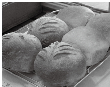
▲自家製クラフトビールパン「ドイツ風田舎パン」

お客様が来なくなった分、より良いものを作って提供しようと考えました。パン販売は完全予約販売にしました。コロナ禍だからこそ、免疫力を付けて、それに負けない体づくりをしてみたいという思いから、この「ドイツ風田舎パン」が生まれました。無添加で酵母が生きたパンです。ハード系のパンですが、深い味わいがあり、噛めば噛むほど味が広がります。そのまま食べてもいいですし、ハムやチーズ、ハチミツなどと一緒に食べても合うと思います。