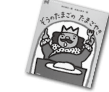
理論社 ぞうのたまごのたまごやき 寺村輝夫：作 和歌山静子：絵

ふんわりした雰囲気の本ですが、なかなか心理描写が繊細です！ こたつで暖まりながらの読書にぴったりの一冊です。