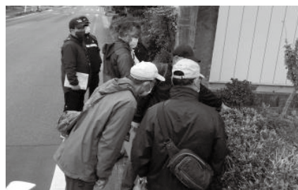
▲境界の標柱に興味津々

桜のきれいな季節にあわせ、フットパスウォークのイベントを企画中です。実施の際はぜひご参加ください！